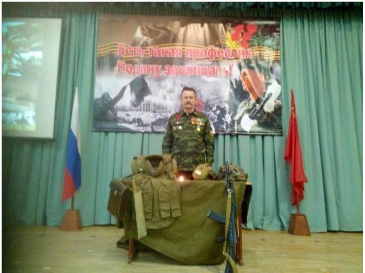
Почётная Вахта памяти на Посту №1 у Вечного огня города –героя Волгограда