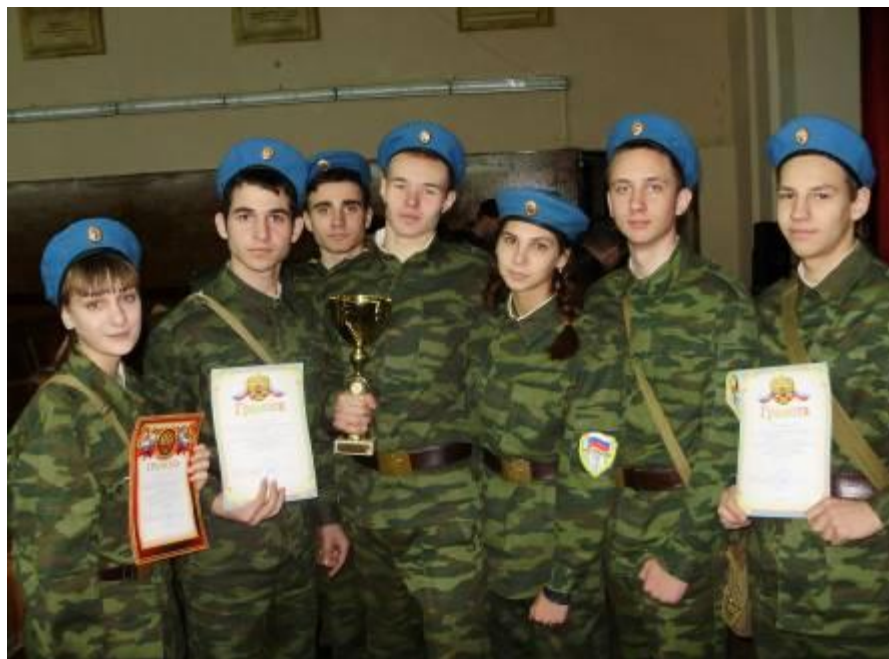
Городские соревнования «Шаги Победы»

Городские соревнования «Боевые рубежи». Наша школа активный участник в различных соревнованиях военно-патриотической направленности, где показывают достойные умения и знания.