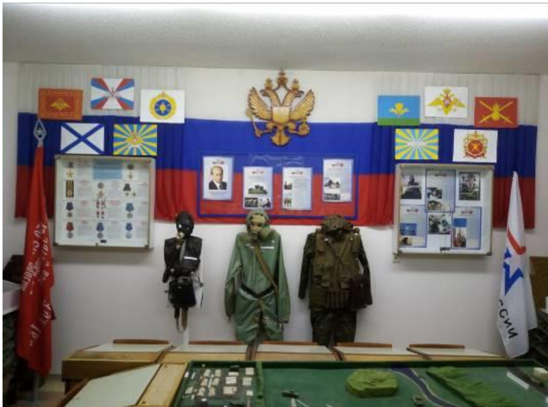
Война с международным терроризмом в Сирийской Арабской республике.