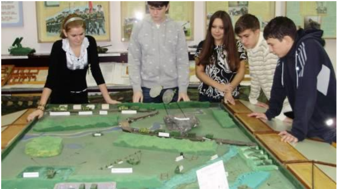
Посещение памятных мест. Участие в городских мероприятиях патриотической направленности.