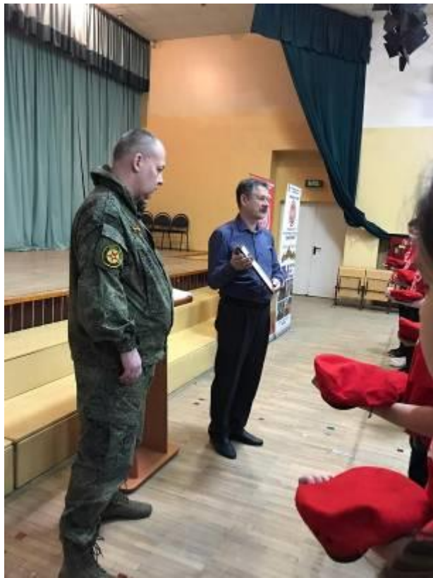
Посещение воинской части. Участие в совместных мероприятиях по патриотическому воспитанию.